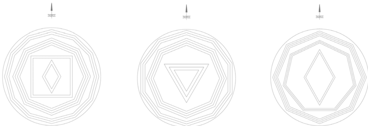
Circuito radionico sistema endocrino

Dato lo stato di disequilibrio riscontrato nei Chakra e i bassi livelli di energia sia generale, che relativi a Chakra ed apparati, sono state effettuate delle verifiche radiestesiche specifiche su quadranti radionici che hanno rivelato quale sistema sia maggiormente in disarmonia: l' endocrino . Si è poi verificato se potessero essere utili circuiti radionici da orientare verso Nord, con la foto della senziante al centro: la verifica radiestesica ha indicato di collocare tre quadranti radionici nella camera da letto per almeno il tempo di durata della somministrazione di Ginelact e Spigavir: circuiti grafici per armonizzazione del sistema endocrino, del sistema genitale femminile, del circuito energetico nei sette Chakra.