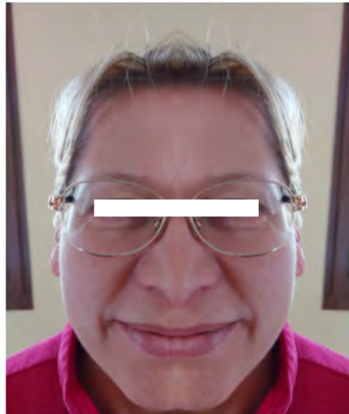
Parte sx raddoppiata